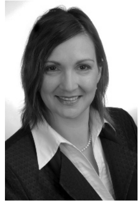
Prof. Dr. Angela Kolb Ministerin der Justiz des Landes Sachsen-Anhalt